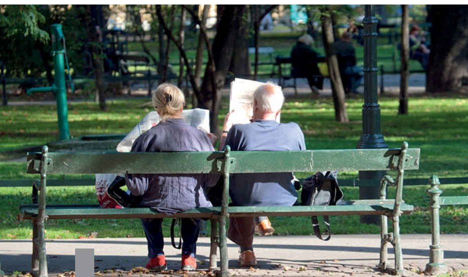
In Zeiten wachsender Städte und dichter Siedlungen werden urbane Grünflächen und grüne Infrastruktur noch wichtiger.

Fast ein Drittel der Menschen in Deutschland lebt in Großstädten – und es werden immer mehr. Bei der Erhaltung der Lebensqualität und des sozialen Zusammenhalts helfen Parks und Grünanlagen. Sie schützen das Klima und bieten Raum für Erholung, Bewegung und Naturerfahrung. In sozial benachteiligten und hochverdichteten Quartieren gibt es oft zu wenige Grünflächen. Abhilfe kann in solchen Fällen eine vertikale Begrünung schaffen. Bepflanzte Gebäudefassaden beeinflussen das Mikroklima positiv, senken die Feinstaubkonzentration und verbessern den Schallschutz. Für die Begrünung von Dächern gibt es mittlerweile viele Lösungsansätze. Die Begrünung vertikaler Flächen wie Gebäudefassaden steckt dagegen noch in den Anfängen. Das Fraunhofer-Institut für Umwelt-, Sicherheits- und Energietechnik hat ein Pilot-system für vertikale Begrünung entwickelt, das bodenungebunden auf der Basis mineralischer Bauelemente aus Kalksandstein funktioniert und bereits jetzt einsatzfähig ist.