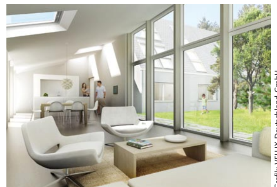
Grafik: VELUX Deutschland GmbH

Grundlage war ein 50er-Jahre-Haus, das aufwändig umgebaut wurde. Große Dachfenster lassen viel Sonne herein, auf einem Anbau sind Solarthermie-Elemente für Heizung und Warmwasser angebracht. Fotovoltaik-Flächen erzeugen Strom. Mit der Solarthermie-Anlage ist eine Luft-Wasser-Wärmepumpe gekoppelt. Ab September 2011 soll eine Familie das Gebäude mietfrei bewohnen – als „Testbewohner“. Ein Jahr lang werden dann Messwerte gesammelt und geprüft, ob das Konzept praxistauglich ist. Dann wird das Haus verkauft – der Preis steht noch nicht fest.