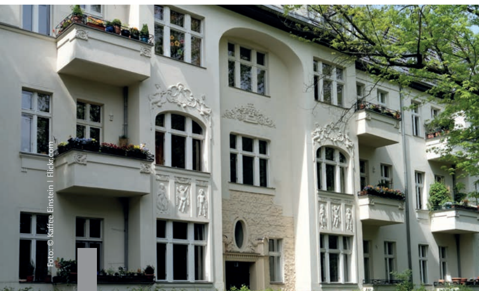
Eigentum verpflichtet – das gilt auch für geerbte Immobilien.

Immobilienerben, die die Immobilie nicht veräußern wollen, sollten sich zügig als neue Eigentümer in das Grundbuch eintragen lassen. Liegt ein Erbschein vor, ist die Änderung beim Amtsgericht zwei Jahre lang gebührenfrei. Danach beträgt die Gebühr rund ein Prozent des Marktpreises. Das kann schnell eine vierstellige Summe werden. Soll das Objekt vermietet oder verkauft werden, verlangt der Gesetzgeber einen Energieausweis, der möglicherweise erst noch zu erstellen ist. Der neue Eigentümer trägt die Verantwortung dafür, dass keine Gefahren von der Immobilie ausgehen und niemand zu Schaden kommen kann. Eine Begehung gibt Aufschluss über die Gegebenheiten: Hält das Dach einem Sturm stand, gefährden morsche Bäume das Nachbargrundstück, und ist für die Schnee- und Eisbeseitigung gesorgt? Auch die Versicherungen und bei Eigentumswohnungen die Protokolle der Eigentümerversammlungen sollten geprüft werden, um unliebsame Überraschungen zu vermeiden.