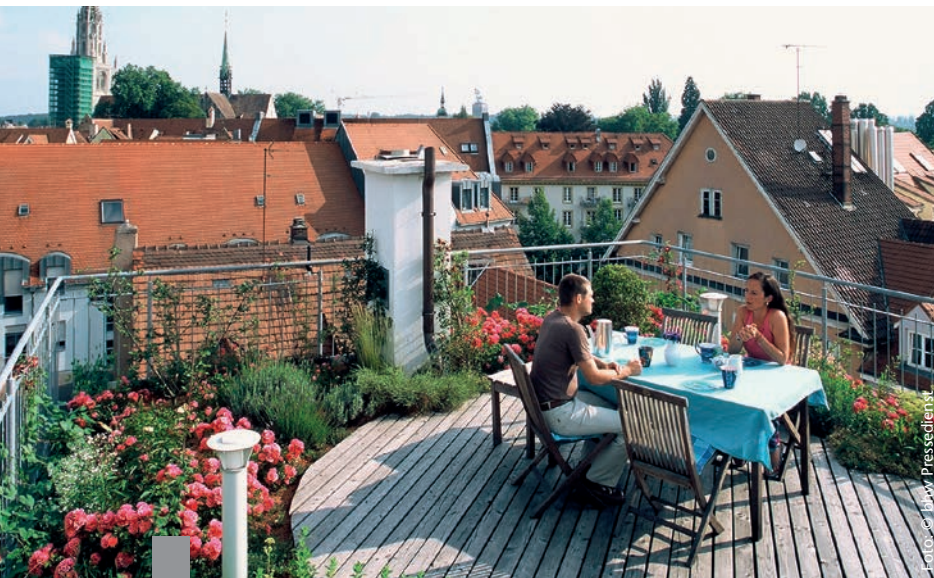
Ob pflegeleicht oder anspruchsvoll, ob individuell oder als Gemeinschaftsanlage – ein Dachgarten erhöht die Attraktivität des Hauses.

Dachgärten in der Stadt liegen im Trend. Sie bieten einen ruhigen Aussichtspunkt, sind individueller Rückzugsort und eine grüne Oase direkt am Haus. Damit schaffen sie einen Ausgleich zum hektischen Stadtleben und erhöhen die Wohnqualität. Wer zugleich mit der Anlage des Dachgartens die Wärme- und Schalldämmung des Gebäudes verbessert, kann sogar Fördergelder der KfW aus dem Programm „Energieeffizient Sanieren“ beantragen. Die Anlage eines Dachgartens ist zudem ein „wohnwirtschaftlicher Zweck“ und kann per Bausparvertrag finanziert werden. Für den Bau sollte man Spezialisten hinzuziehen, die wissen, wie man die Bepflanzung auf die Konstruktion des Dachs abstimmt. Die Begrünung mit verschiedenen Pflanzen und Gräsern kann so kombiniert werden, dass sich das ganze Jahr über ein prächtiger Anblick bietet. Je nach Unterbau ist auch eine intensive Begrünung mit Bäumen, Sträuchern und Stauden möglich. Besondere Highlights sind Hochbeete für frisches Gemüse und Kräutergärten.