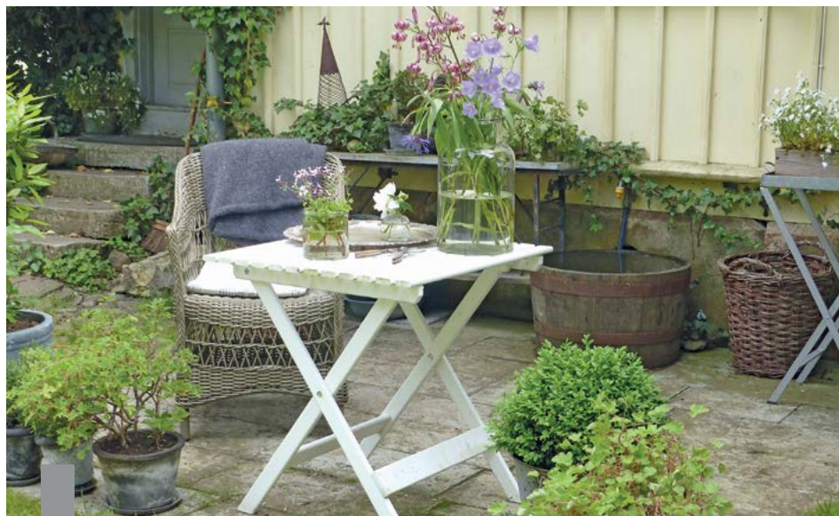
Die hohen Preise in den Großstädten sind für Immobilienkäufer und Mieter auf der Suche nach einem bezahlbaren neuen Zuhause frustrierend.

Seit der Jahrtausendwende zieht es die Menschen vermehrt in die Städte. Die Metropolen wuchsen. Dieser Trend setzt sich bis heute fort, doch einige große Städte wie Hamburg, München oder Stuttgart verzeichnen erstmals einen negativen Wanderungssaldo. Ein Grund sind die hohen Immobilienpreise und Mieten, denn für alle Metropolen gilt: Das Wohnen im Umland ist günstiger als in der Stadt. Das knappe Wohnungsangebot und die hohen Preise frustrieren die Nachfrager zunehmend und veranlassen sie, sich nach Alternativen umzuschauen. Der Blick geht an den Stadtrand, ins Umland oder in ländliche Gemeinden. Die haben über die günstigen Preise hinaus etwas zu bieten, was in der Stadt rar ist: die Nähe zur Natur, Entschleunigung, die Rückkehr zu Freunden und Familie. Laut aktuellem Baukulturbericht wollen 55 Prozent der 30- bis 40-Jährigen am liebsten in einer Landgemeinde wohnen, 27 Prozent in einer Mittel- oder Kleinstadt, aber nur 18 Prozent in einer Großstadt.