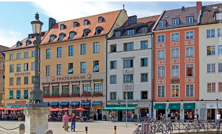
Die Flexibilität eines Gebäudes im Hinblick auf seine Nutzung ist ein Qualitätsmerkmal. Für die Zukunft eines Hauses ist entscheidend, ob es den wechselnden Bedürfnissen der Menschen auch nach vielen Jahren noch gerecht werden kann.

Der berühmte Architekt Mies van der Rohe soll in einem Gespräch schon 1964 gesagt haben: „Menschkind, mach‘ doch die Bude groß genug, dann kannst du hin und her laufen und nicht bloß in einer vorgezeichneten Bewegung. [...] Wir wissen ja gar nicht, ob die Leute das benutzen, wie wir es gerne möchten. Die Funktionen sind erstens mal nicht eindeutig, und dann sind sie nicht beständig, die wechseln viel schneller als der Bau.“ Diese über 40 Jahre alte Aussage hat noch immer ihre Berechtigung, denn Städte sind lebendige Lebensräume, die sich immer wieder verändern. Wurden sie vor Jahrzehnten autogerecht ausgebaut und nach Nutzung gegliedert, steht heute die Durchmischung von Wohnen, Arbeiten, Kultur und Einkaufen im Vordergrund. Im Wandel muss sich erweisen, ob die bestehenden Gebäude zukunftsfähig und in ihrer Nutzung flexibel sind. Im positiven Fall finden dann zum Beispiel leer stehende Bürogebäude oder Läden eine neue Verwendung.